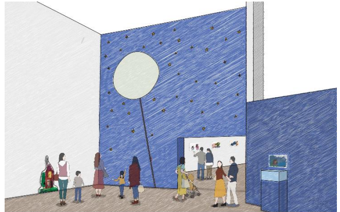
株式会社丹青ディスプレイ/しまたびデザイン

会場には本展の思い出が残せるよう、『はらぺこあおむし』『パパ、お月さまとって！』のフォトスポットを用意しています。ぜひ来場の記念にお楽しみください。