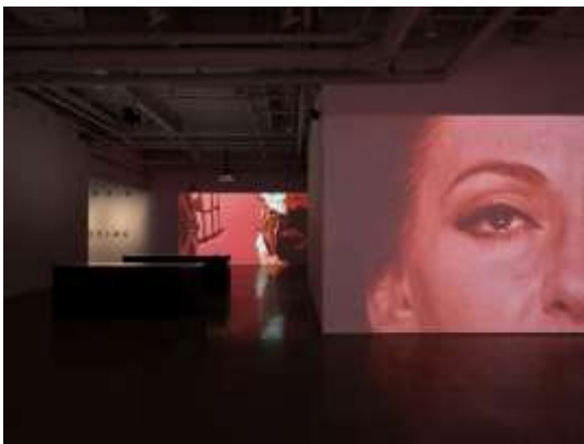
04 Soundwalk Collective & Patti Smith 'Correspondences' - kurimanzutto NY (installation view)

ステファンが詩的な靈感や歴史的な重要性をもつ土地を訪れフィールドレコーディングによって「音の記憶」を採集し、パティがその録音との親密な対話を重ねて詩を書き下ろし、さらにそのサウンドトラックに合わせてサウンドウォーク・コレクティブが映像を編集します。こうした“往復書簡(=コレスポンドンス)”によって生まれたのが、本展の根幹を成す8つの映像《Pasolini》《Medea》《Children of Chernobyl》《The Acolyte, the Artist and Nature》《Cry of the Lost》《Prince of Anarchy》《Mass Extinction 1946-2024》《Burning 1946-2024》です。