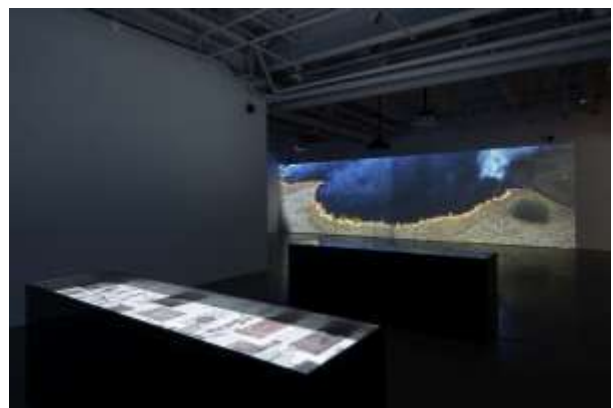
05 Soundwalk Collective & Patti Smith 'Correspondences' - kurimanzutto NY (installation view)