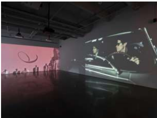
07 Soundwalk Collective & Patti Smith 'Correspondences' - kurimanzutto NY (installation view)

本展の映像は、アンドレイ・タルコフスキーの『アンドレイ・ルブリョフ』や、マリア・カラスがギリシャ悲劇の王女を演じたピエル・パオロ・パゾリーニの『王女メディア』（Cinemazero 提供）、殺害されたイタリアの巨匠ピエル・パオロ・パゾリーニ最期の日を描いたアベル・フェラーラの『パゾリーニ（原題）』といった映画の貴重な未公開映像のほか、NASAの衛星写真、研究財団TBA21-Academyとの協業により可視化した海洋データ、さらにはジャン＝リュック・ゴダールの肉声を使用し、編集されています。