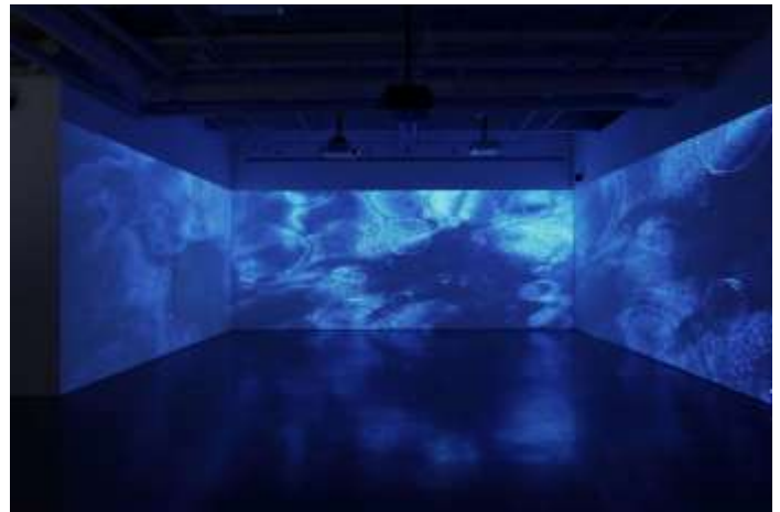
08 Soundwalk Collective & Patti Smith 'Correspondences' - kurimanzutto NY (installation view)