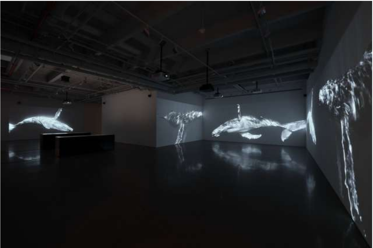
03 Soundwalk Collective & Patti Smith 'Correspondences' - kurimanzutto NY (installation view)