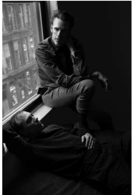
09 B

サウンドウォーク・コレクティブは、アーティストのステファン・クラスニアンスキーとプロデューサーのシモーヌ・メルリが率いる現代音響芸術コレクティブ。アーティストやミュージシャンとの共同作業により、コンセプトや文学、芸術的なテーマを検証するために、場所や状況に応じたサウンドプロジェクトを展開。パティ・スミスや映画監督のジャン＝リュック・ゴダール、写真家のナン・ゴールディン、振付家のサシャ・ヴァルツ、女優で歌手のシャルロット・ゲンズブールといったアーティストたちとの長期的なコラボレーションを行なう。彼らの実践はアートインスタレーション、ダンス、音楽、映画と多岐にわたり、音を詩的で感触を伴う素材として扱うことで異なるメディアを結びつけ、複層的な物語を創造することを可能にしている。2022年のベネチア国際映画祭で金獅子賞を受賞したローラ・ポイトラス監督の『美と殺戮のすべて』ではオリジナルサウンドトラックを制作した。これまでポンピドゥ・センター（パリ）、ドクメンタ（カッセル）、クンストヴェルケ現代美術センター（ベルリン）、ニューミュージアム（NY）などで展示やパフォーマンスを発表している。