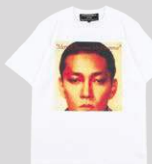
Merry Christmas Mr.Lawrence