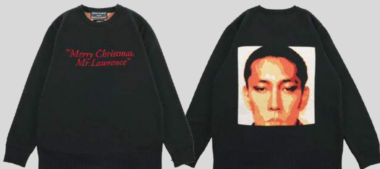
Merry Christmas Mr.Lawrence