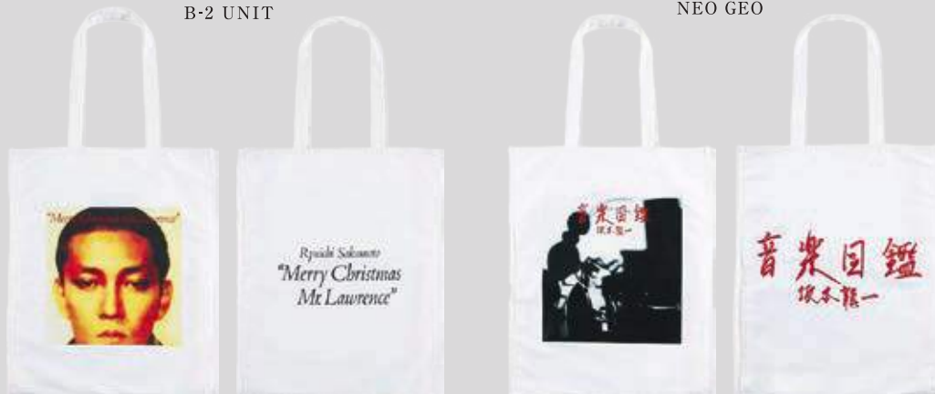
Merry Christmas Mr. Lawrence